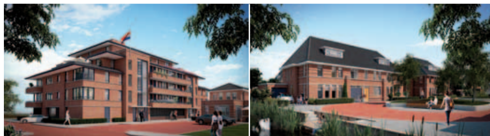
Artist impressions van de appartementen en 2/3- en 1-kapwoningen